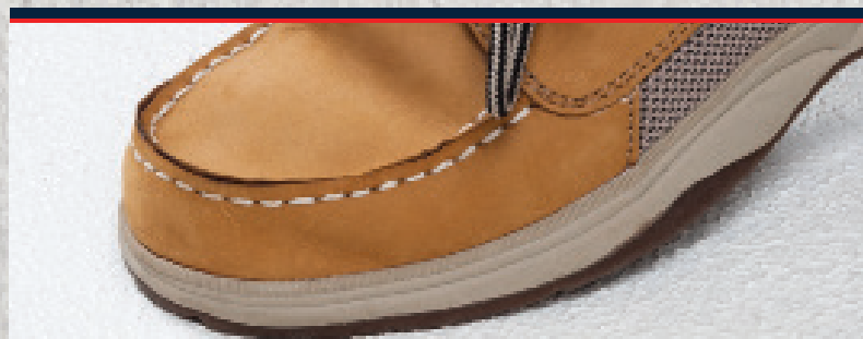
Overlegent skridsikkert underlag for næsten ethvert emne.